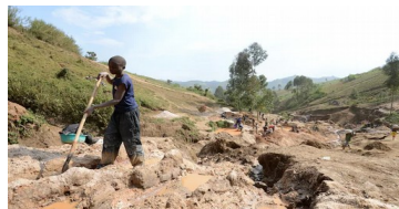
Un enfant sépare du minéral de la roche et du sable près de la mine de Mudere, dans la région de Rubaya, en RDC.

Il va notamment être intéressant de connaître la décision de la Cour suprême des États-Unis concernant les plaintes en cours contre Nestlé et Cargill : rendez-vous fin juin 2021.