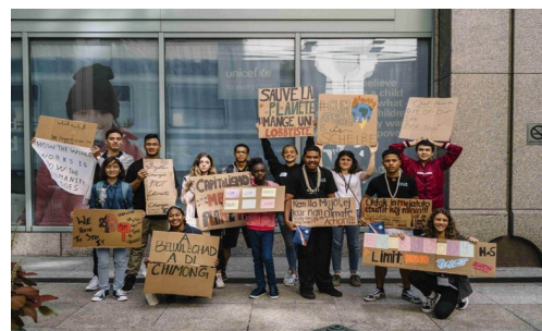
Youth activists from all continents bring a complaint to the UN Committee on the Rights of the Child (CRC) on climate change.

*Calendriers juif, maya, arménien, chrétien, sayana, musulman, persan et... républicain ! Qui ne commencent pas tous forcément le 1er janvier ! Mais bon... Il y en a bien d'autres, voyez vos encyclopédies habituelles.